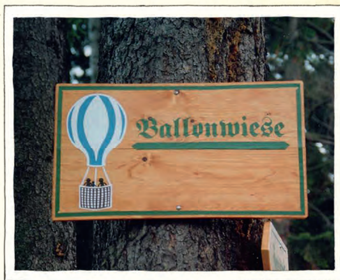
Un indicator din Bavaria care marchează locul în care a aterizat balonul