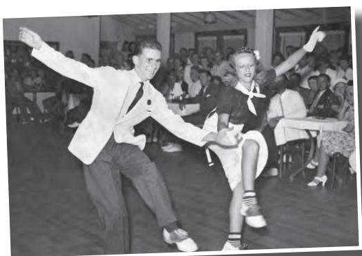
rock and roll

Concomitent cu muzica, au apărut și dansurile specifice. Dintre dansurile moderne, le amintim pe cele de mai jos: