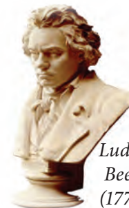
Ludwig van Beethoven (1770-1827)

În anumite cercuri sociale, petrecerea timpului liber presupunea cunoașterea unor dansuri.