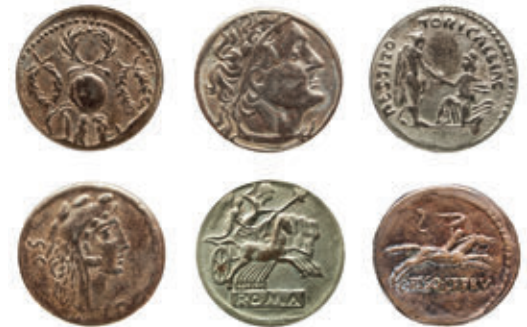
Abb. 6 – Münzen