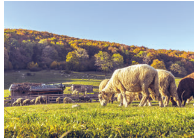
Abb. 6 – Schafzucht