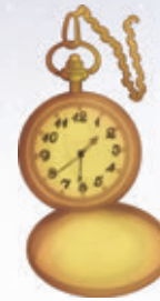
Abb. 4 – mechanische Uhr