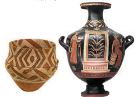
Abb. 7 – Keramikgefäße