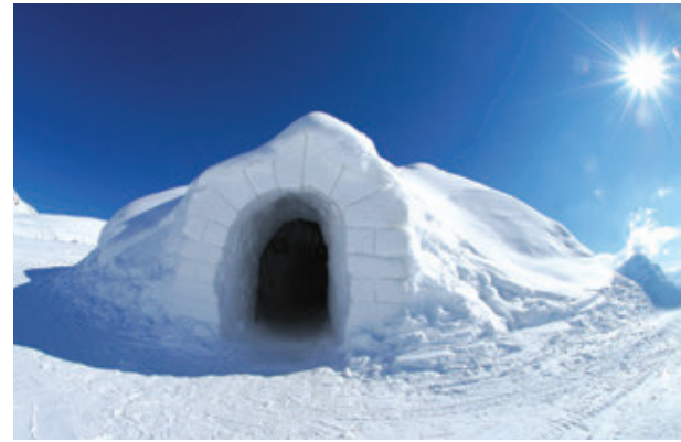
Abb. 5 – Behausung im Polargebiet

Das Leben der Menschen wurde und wird vom geographischen Umfeld und vom Klima beeinflusst. Die Menschen waren ständig gezwungen sich den natürlichen Bedingungen anzupassen und ihre Beschäftigungen und Gehöfte unterscheiden sich je nach Relief, Klima, Wasserquellen (Abb. 5-6).