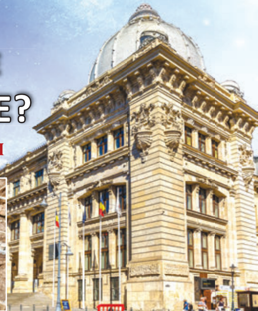
Abb. 2 – Das Nationale Geschichtsmuseum Rumäniens, Bukarest