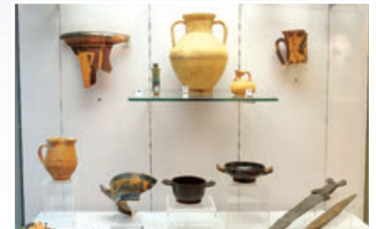
Abb. 4 – Gegenstände mit historischem Wert