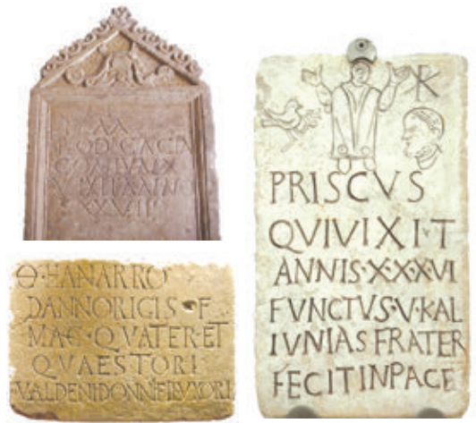
Abb. 5 – Inschriften

Die Archäologen entdecken die Geschichtsquellen infolge archäologischer Grabungen (Abb.1) und teilen den Geschichtsschreibern, nach Analysen im Labor (Abb.3), wichtige Informationen mit. Viele dieser Entdeckungen werden in Museen, Bibliotheken und Archiven aufbewahrt (Abb.2 und 4).