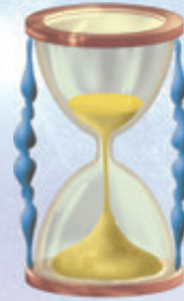
Abb. 2 – Sanduhr