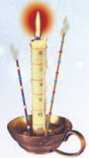
Abb. 3 – Kerzenuhr