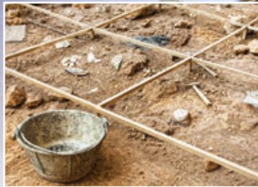
Abb. 1 – Archäologische Grabungen