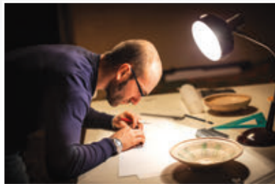
Abb. 3 – Archäologe im Labor