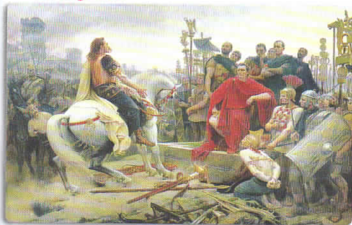
Vercingetorix își aruncă armele la picioarele lui Iulius Cezar, de Lionel Royer

Căderea Alesiei și capturarea lui Vercingetorix a marcat cucerirea romană a Galiei Libere. Legenda spune că Vercingetorix s-a predat într-o manieră impunătoare: a ieșit din Alesia și a făcut înconjurul taberei lui Cezar călare, înainte de a-și arunca armele la pământ la picioarele lui, dându-și jos armura și îngenunchind în fața împăratului. A stat în închisoarea de la Tullianum din Roma cinci ani, înainte de a fi expus public la parada triumfală a lui Cezar din anul 46 î.H. A fost executat după paradă, probabil prin strangulare în închisoare, așa cum era tradiția.