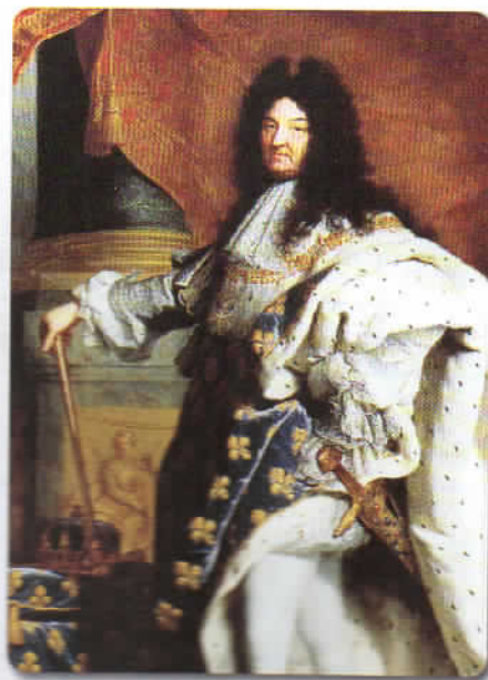
Ludovic al XIV-lea, de Hyacinthe Rigaud, 1701

Describe cum era îmbrăcat Ludovic al XIV-lea.