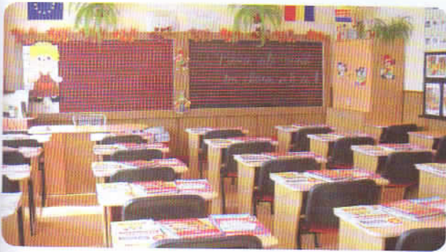
Sala de clasă

1. Analizează cele două imagini de mai jos și numește cel puțin cinci obiecte din sala de clasă și cel puțin trei lucruri pe care le observi în curtea școlii.