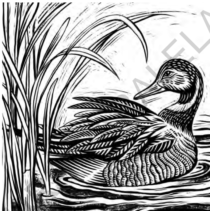
Penajul de eclipsă al raței